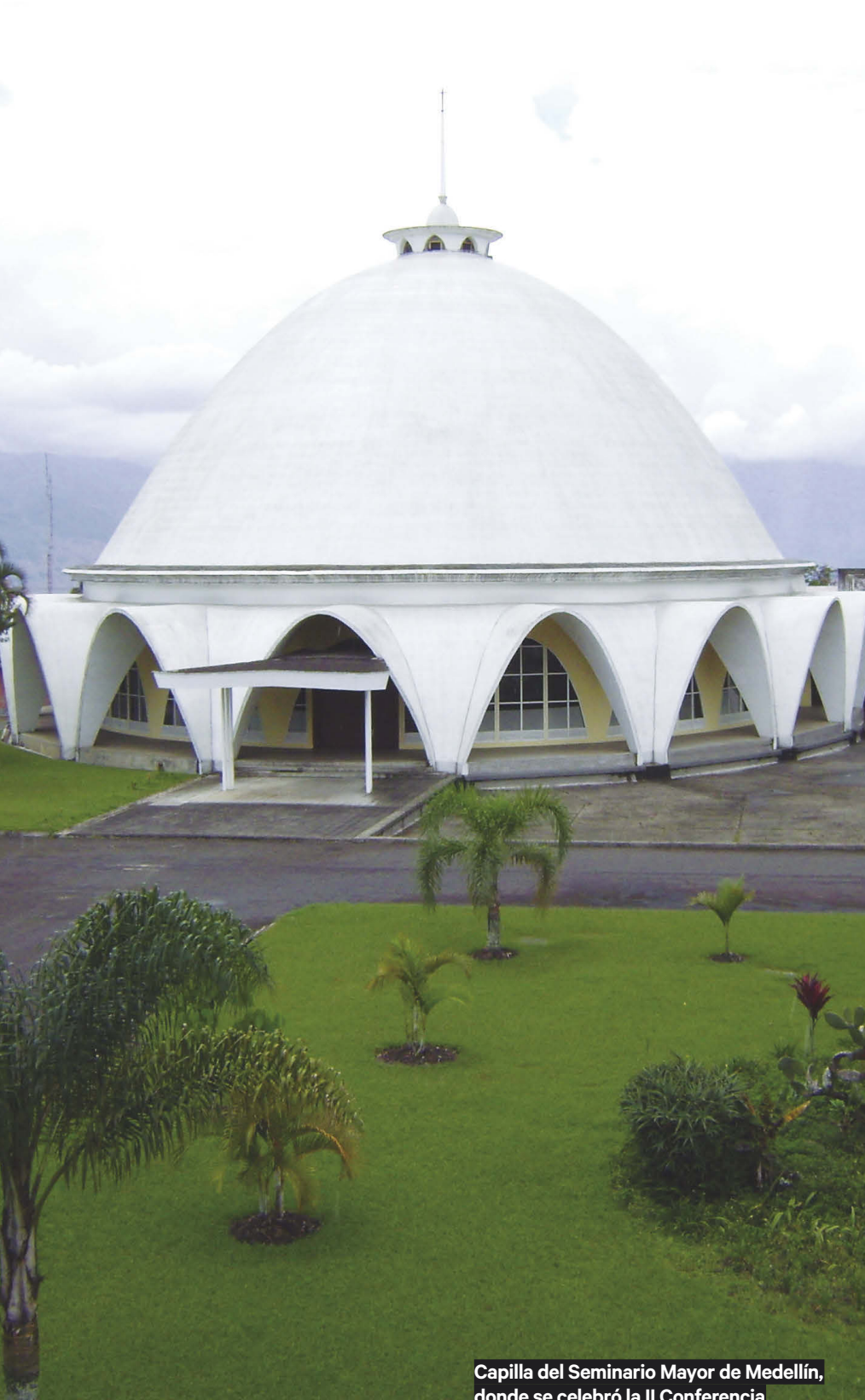
Capilla del Seminario Mayor de Medellín, donde se celebró la II Conferencia del episcopado latinoamericano.