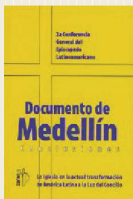
Documento de Medellín CELAM, 1968