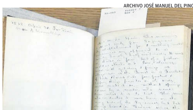
VIAJE POR ESPAÑA, 1818

► En 2012, la Universidad de Zaragoza publicó los 'Diarios de viaje por España' de George Ticknor, quien durante cinco meses y medio de 1818 recorrió nuestro país, todavía con las huellas de la cruenta guerra contra Napoleón.