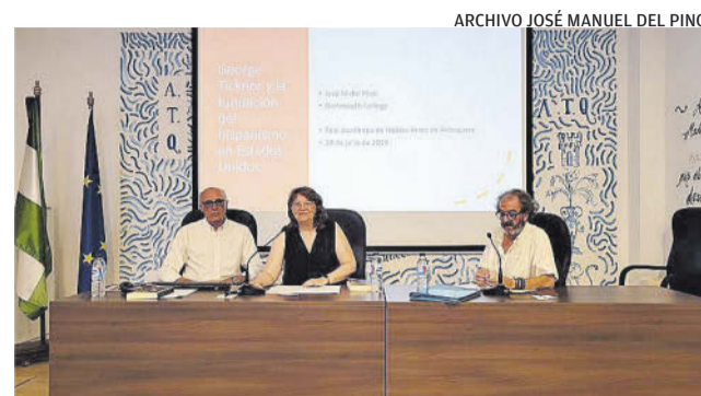
PRESENTACIÓN EN ANTEQUERA

► En 2012, la Universidad de Zaragoza publicó los 'Diarios de viaje por España' de George Ticknor, quien durante cinco meses y medio de 1818 recorrió nuestro país, todavía con las huellas de la cruenta guerra contra Napoleón.