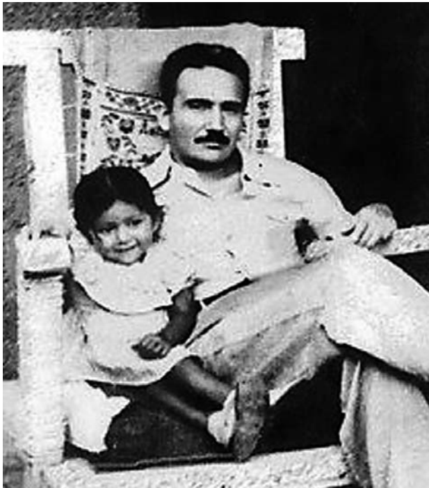
Figura 1. José María Arguedas.

relación misteriosa y seductora que vivifica a la obra literaria, a través de libros como Puentes sobre el mundo. Cultura, traducción y forma literaria en las narrativas de transculturación de José María Arguedas y Vikram Chandra y José María Arguedas y el cine .