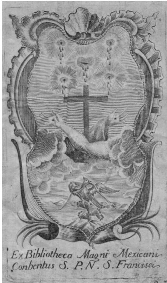
Imagen n. 2: Ex Libris del manuscrito de Quirós (parte interior de la cubierta trasera).